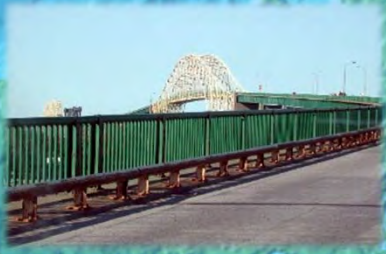
PONT INTERNATIONAL DE SAULT STE. MARIE SAULT STE. MARIE