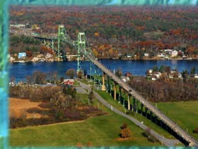
PONT DES MILLE-ÎLES LANSDOWNE