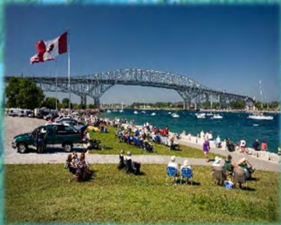
PONT BLUEWATER POINT EDWARD