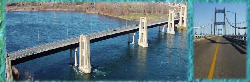
PONT INTERNATIONAL DE LA VOIE MARITIME CORNWALL